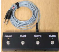
Symbolfoto (ev. Unterschiede: Beschriftung, Stecker)